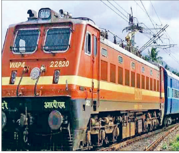
रेवाड़ी। रेवाड़ी रेलमार्ग से गुजरते हुए एक्सप्रेस ट्रेन।