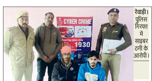
रेवाड़ी। पुलिस गिरफ्तार में साइबर ठगी के आरोपी।