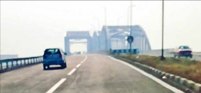
शुरू किया गया आउटर बाईपास का ओवरब्रिज

टोल प्लाजा के पास नारनौल की ओर से आने वाले वाहनों के लिए पर्याप्त जगह तक सड़क पर नहीं बचती