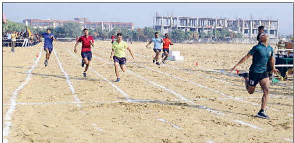
रेवाड़ी। दौड़ प्रतियोगिता में दम दिखाते हुए कैडेट्स तथा विजेता कैडेट्स को सम्मानित करते अतिथि।