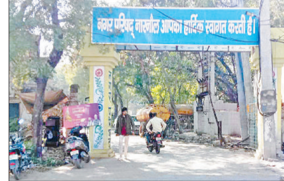
नारनौल। नगर परिषद कार्यालय।

नगर परिषद ने हाउस टैक्स के बकायेदारों के लिए खतरे की घंटी बजा दी है। परिषद ने इन बकायेदारों को नोटिस और हाउस टैक्स के बिल जारी किए हैं, जिसमें उन्हें एक सप्ताह में बकाया हाउस टैक्स जमा कराने के लिए कहा गया है। नोटिस में चला-अचल संपत्ति कुर्क करवाई जाएगी