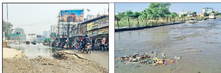
रेवाड़ी। धारूहेड़ा की ओर आ रहा दूषित पानी तथा सेक्टर मार्ग पर जमा दूषित पानी।